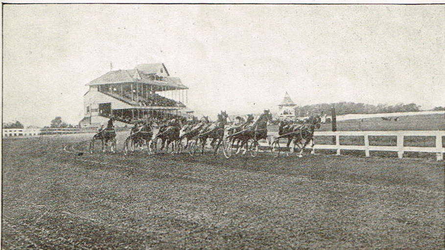
Trotting-Track — Lexington.

Paa en Væddeløbsdag i Lexington er man tidligt paa færde. Saa snart man har