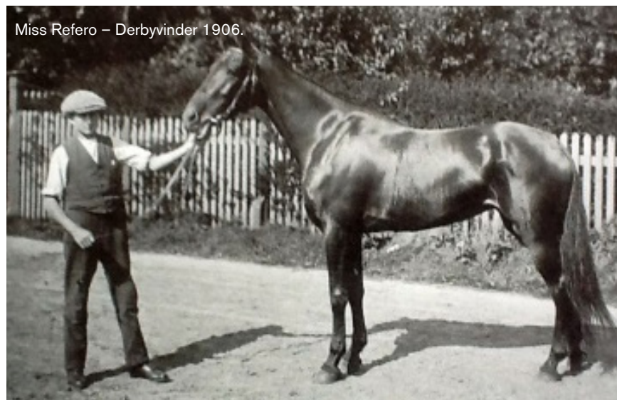
Miss Refero – Derbyvinder 1906.