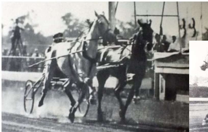
Greyhound/Rosalind på vej mod ny verdensrekord i Indiana i 1939.