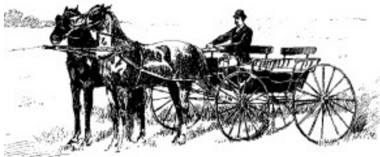
Tospand på Lyngbyvejens tid.

Den specielle travdisciplin tospand er kun gennemført i Danmark i tre korte perioder og med store mellemrum. Der var ikke færre end fire Derbyvindere skrevet til start, da det første tospandsløb i mange år skulle køres på Charlottenlund Travbane onsdag den 20. juni 1906. Den 3-årige Dagmar Lamott vidste det selvfølgelig ikke endnu, ligesom den rødskimlede datter Kaja B af sportens første hoppestjerne Nano ikke havde givet vink om, at hun kunne blive nummer to til Dagmar Lamott i Derbyet året efter.