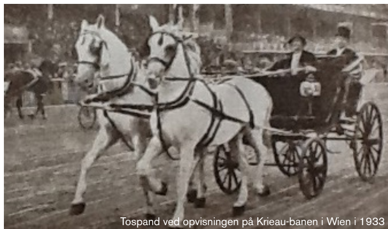
Tospand ved opvisningen på Krieau-banen i Wien i 1933

Romersk vædde- løbsvogn eller "biga" (tospand) fra vatican- museet i Rom.