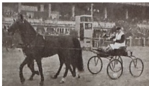
Tospand for buggy i Wien 1933.